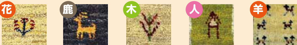
花 明るさ・美しさ あこがれの象徴