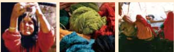
「紡ぐ」 「染める」 「手織り」